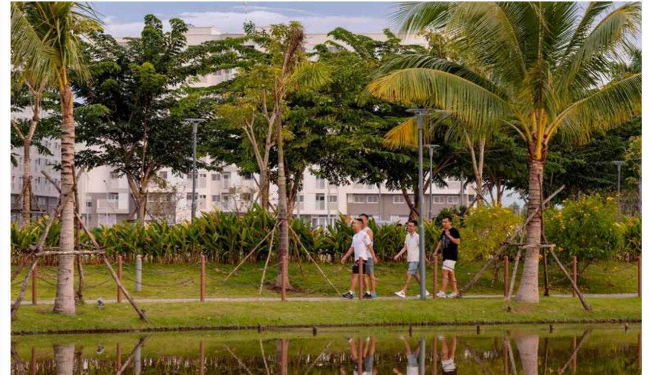
Trong năm 2025, Long An, Đồng Nai, Bình Dương giữ vị thế chủ đạo về nguồn cung và lượng tiêu thụ nhà phố, biệt thự.