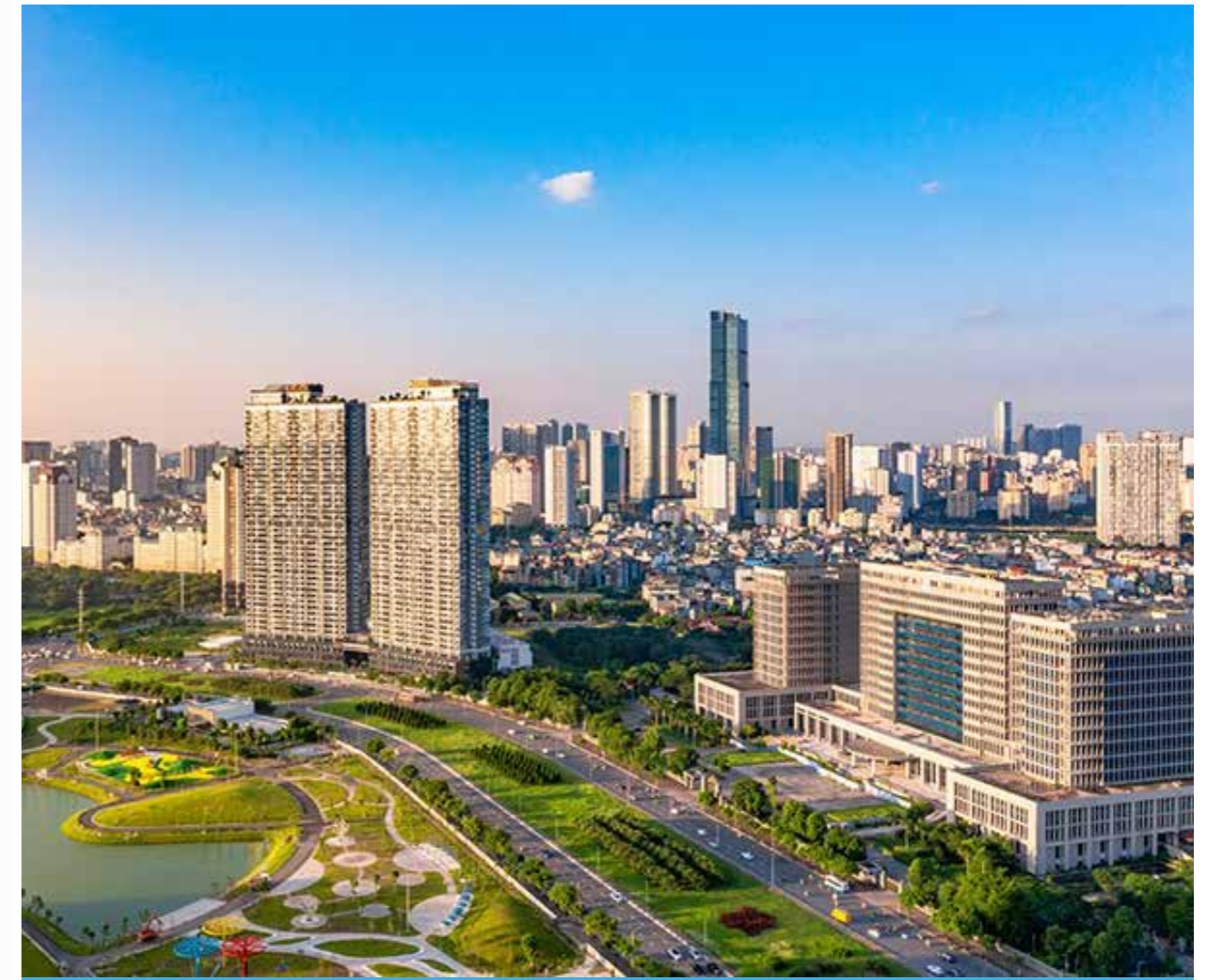
Phân khúc chung cư cao cấp và hạng sang vẫn tiếp tục dẫn dắt thị trường trong năm 2025

Thời gian qua, sự đột phá về thể chế và cải cách hành chính trong các bộ luật với những thay đổi nhanh chóng và mạnh mẽ cũng trở thành động lực quan trọng giúp thị trường bất động sản phát triển. Nhiều bộ luật liên quan đến đất đai, xây dựng và đầu tư đang được sửa đổi và hoàn thiện, tạo ra một môi trường pháp lý thuận lợi, minh bạch cho thị trường địa ốc.