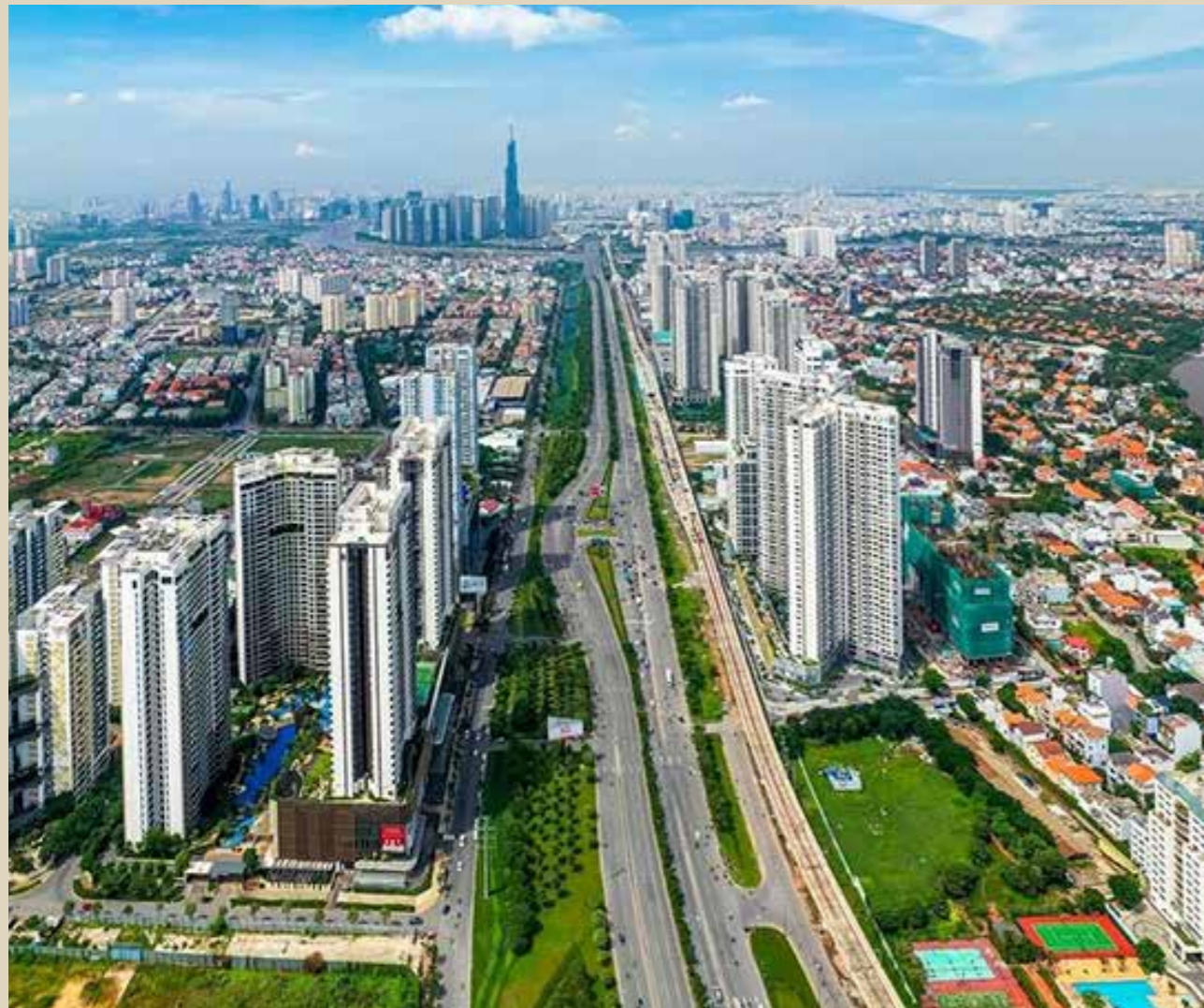
Thị trường bất động sản năm 2025 bước vào chu kỳ phát triển bền vững với rất nhiều trợ lực mạnh mẽ.

Thị trường bất động sản Việt Nam năm 2025 được dự báo sẽ bước vào chu kỳ phát triển mới, đầy hứa hẹn và bền vững hơn nhờ những trợ lực vững chắc từ việc hoàn thiện khung pháp lý, niềm tin của nhà đầu tư được củng cố và các yếu tố tăng trưởng mạnh mẽ về nền kinh tế vĩ mô.