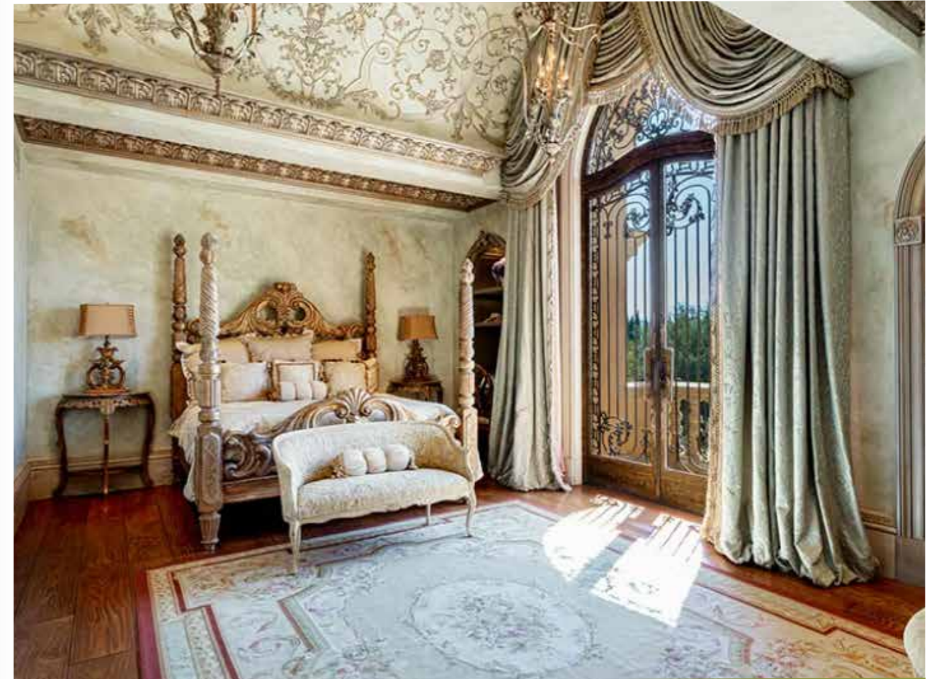
Một trong những phòng ngủ

Dinh thự nằm trên một khu đất có diện tích gần 1 hecta với nhiều tiện ích ngoài trời cực kỳ thú vị. Nếu không còn hứng thú làm một ván cờ với những quân cờ cao hơn 1,8 mét, bạn có thể thỏa sức ngâm mình trong hồ bơi vô cực, chơi golf tại gia hoặc thưởng thức bữa tối ngoài trời tại một trong những không gian giải trí trong khuôn viên dinh thự.