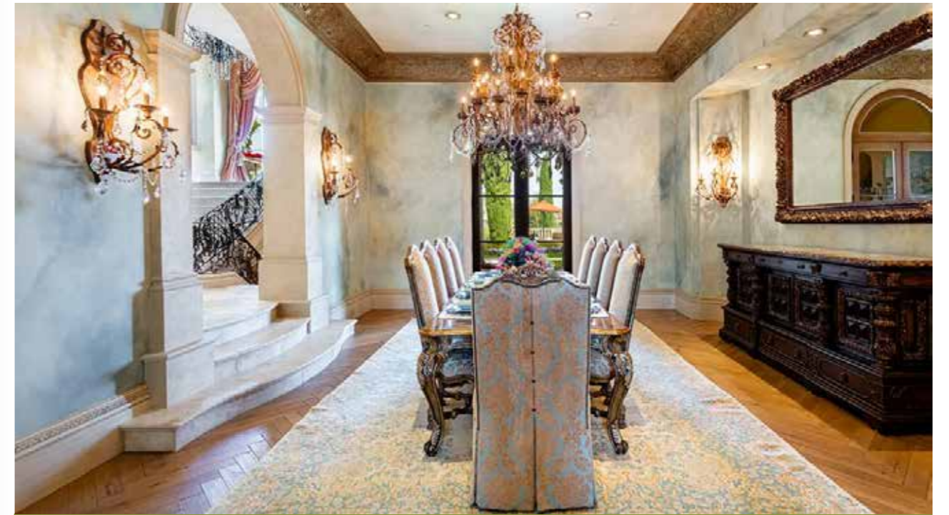
Phòng ăn