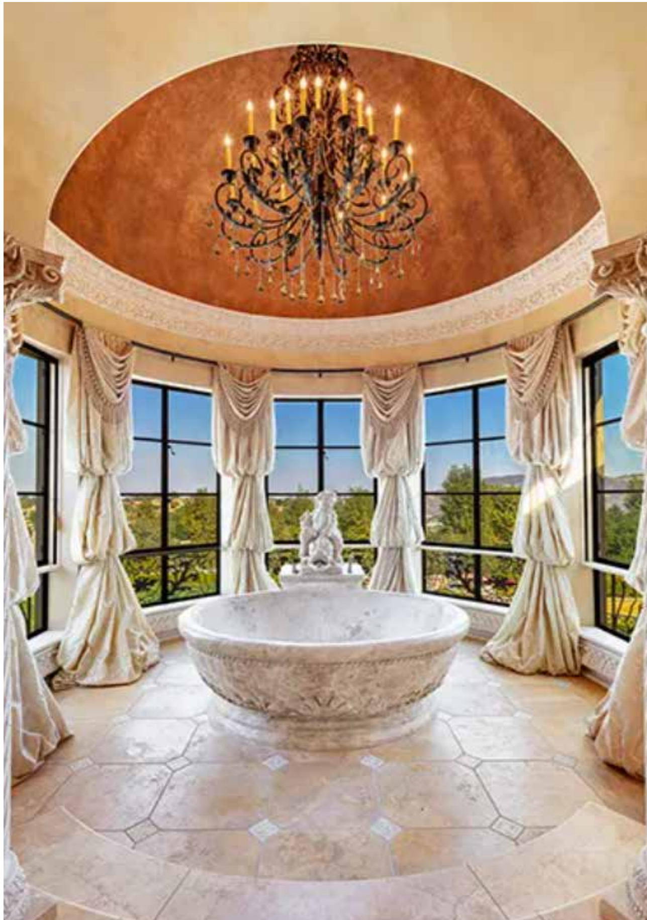
Phòng tắm chính