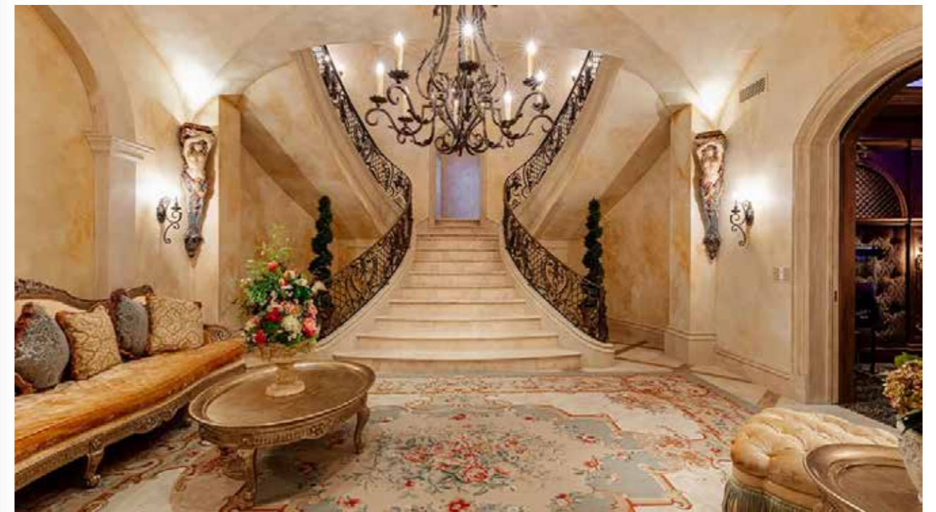
Lối vào biệt thự