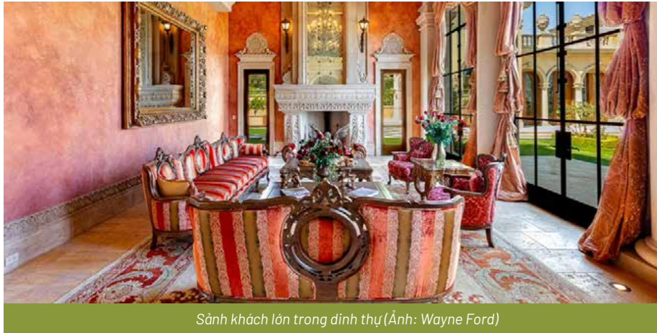
Sảnh khách lớn trong dinh thự

Dĩ nhiên, dinh thự của Gibson cũng nằm trong số những dự án mà Hablinski đặc biệt để tâm. Cơ ngơi có diện tích gần 1.500 mét vuông và được lắp đặt hệ thống lò sưởi từ đá travertine, ban công Juliet (ban công nhỏ vừa đủ cho 1-2 người) và những đường gờ tùy biến tỉ mỉ. Ngôi nhà sở hữu 5 phòng ngủ và 7 phòng tắm, một nhà khách riêng biệt với 2 giường ngủ và 2 phòng tắm.