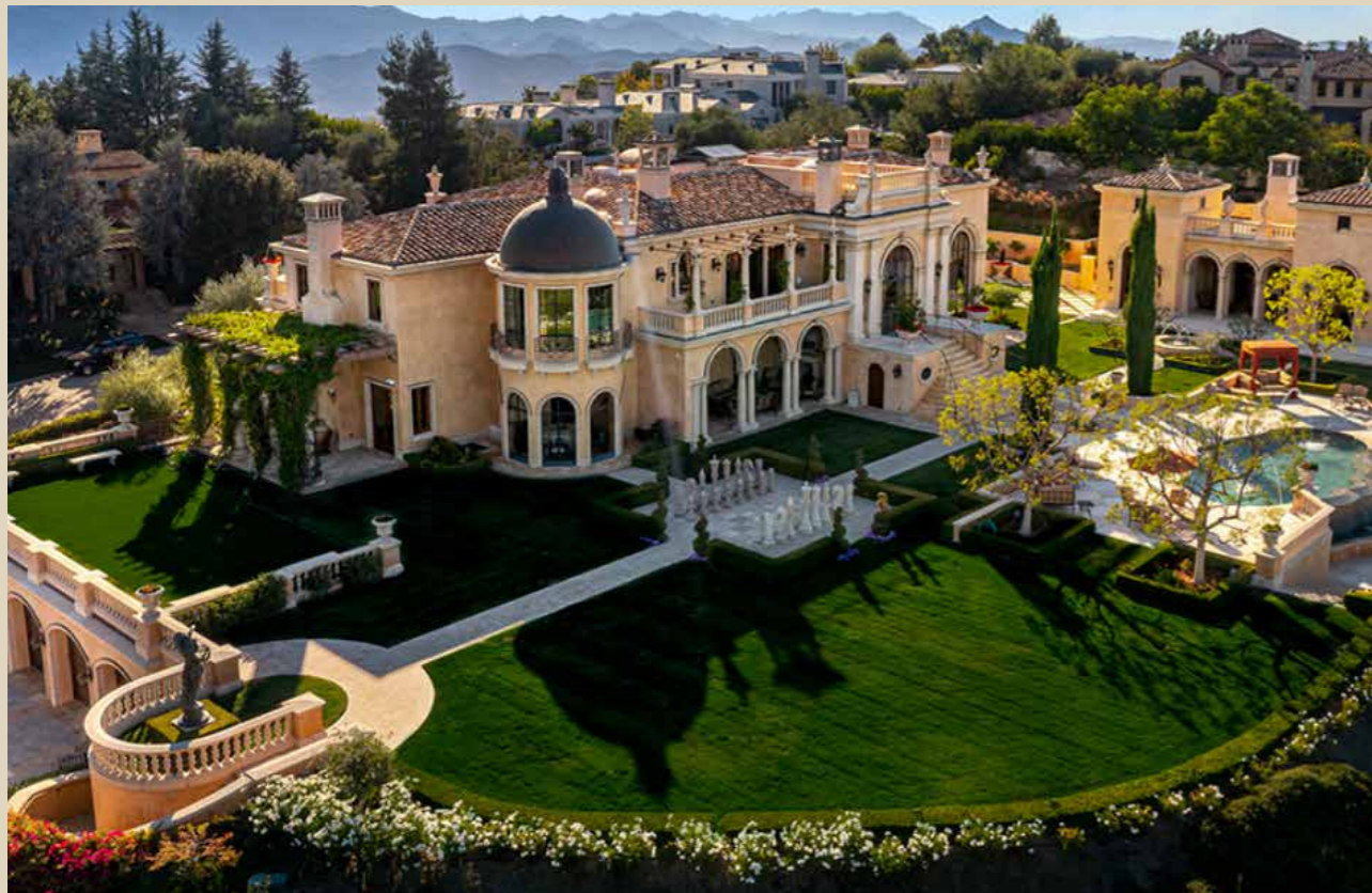
Dinh thự giá 30 triệu USD sở hữu sân đánh golf và bộ cờ vua ngoài trời khổng lồ.

Nếu đã từng xem qua và yêu thích bộ phim The Queen's Gambit , dinh thự giá 30 triệu USD tại Calabasas (California) chắc chắn sẽ thu hút sự chú ý của bạn. Đây không đơn thuần là một ngôi nhà rộng lớn được thiết kế theo lối kiến trúc Palazzo (phong cách được ưa chuộng bởi tầng lớp thượng lưu tại nước Ý vào thế kỷ 19-20), điều đặc biệt hơn cả là nơi đây sở hữu một bàn cờ ngoài trời có kích thước như thật.