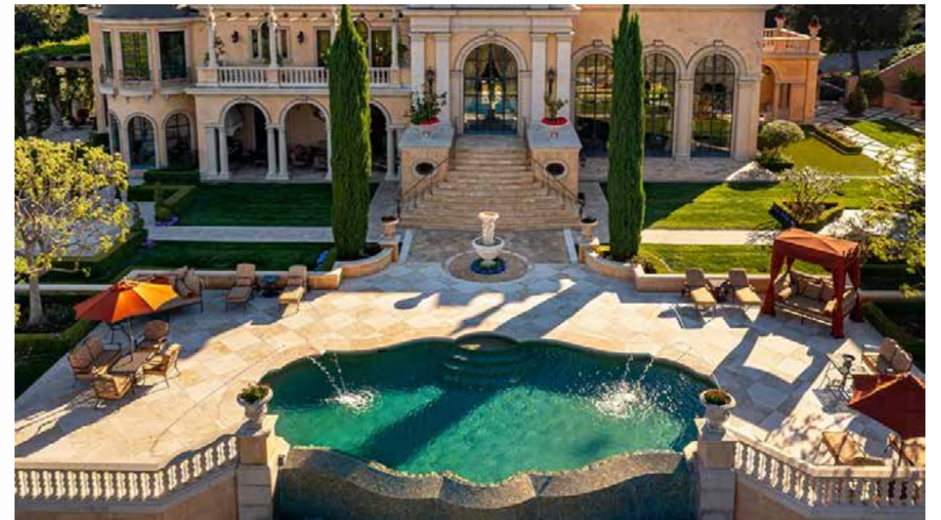
Hồ bơi ngoài trời