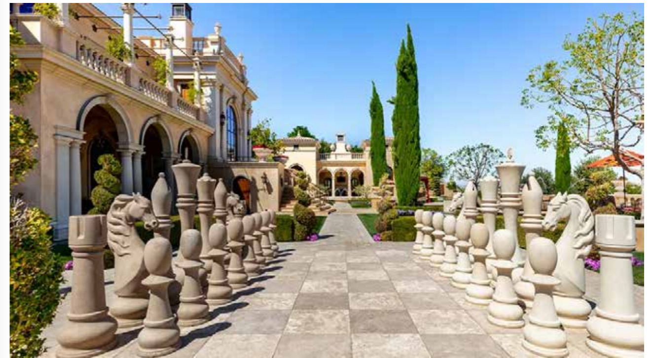
Bộ cờ vua ngoài trời tại dinh thự giá 30 triệu USD thuộc khu Calabasas, California