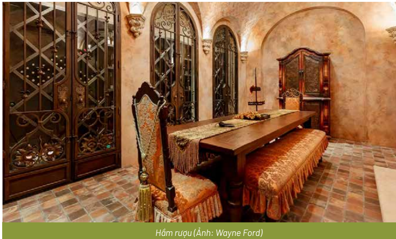
Hầm rượu

Bên trong dinh thự có một thư viện, một nhà rạp chiếu phim, phòng gym và mát-xa. Ngoài ra, nơi này còn được thiết kế một hầm rượu có thể chứa tới 5.000 chai rượu vang. Tại ban công lầu trên, bạn có thể ngắm nhìn Thung lũng San Fernando qua mái kính có khả năng thu gợn.